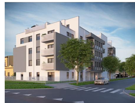
43/1. Mikro Apart. - 29.9 (36.1)

Umieblowanie pomieszczeń ma charakter poglądowy. Ilustrujący gabaryty przestrzeni i nie stanowi oferty handlowej.